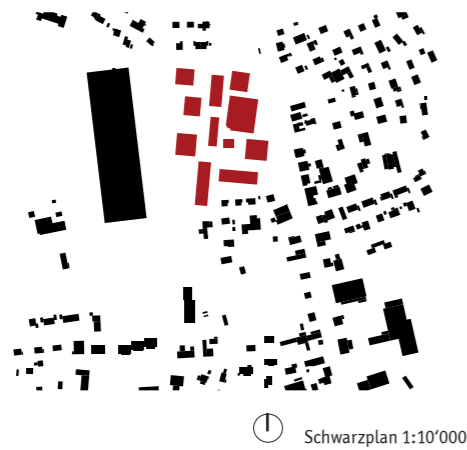
⌚ Schwarzplan 1:10'000