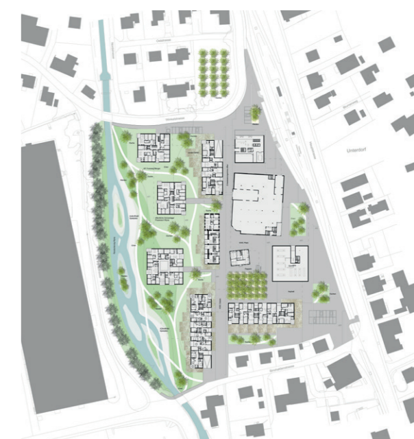
Lageplan Quartier und Umgebung