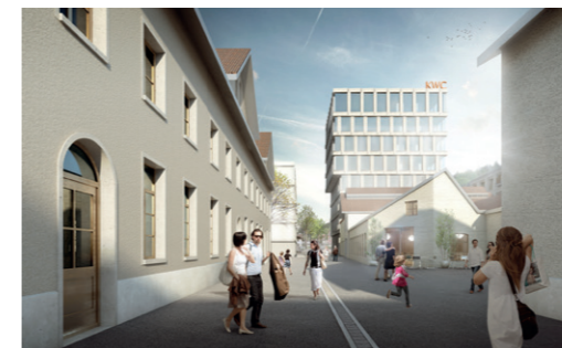
Blick über die Hauptachse zum neuen KWC-Hauptsitz

Ackermann + Wernli AG, Raumplanung Metron Verkehrsplanung AG david&vonarx landschaftsarchitektur gmbh