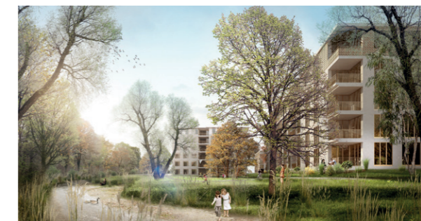
Blick über die Wyna zu den neuen Wohnhäusern