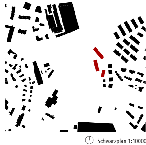
⌚ Schwarzplan 1:10000