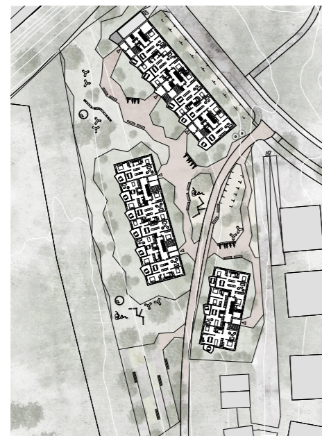
⌚ Umgebungsplan 1:2000