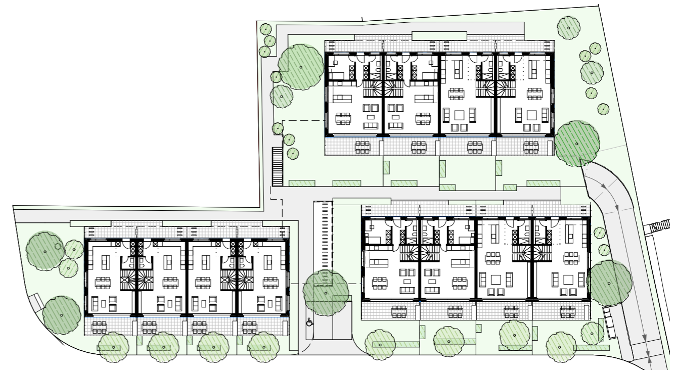
⌚ Umgebungsplan 1:500