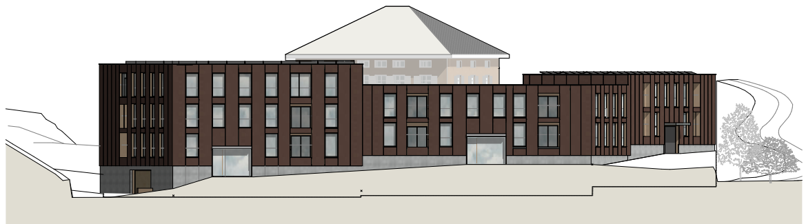
Fassade West 1 : 400