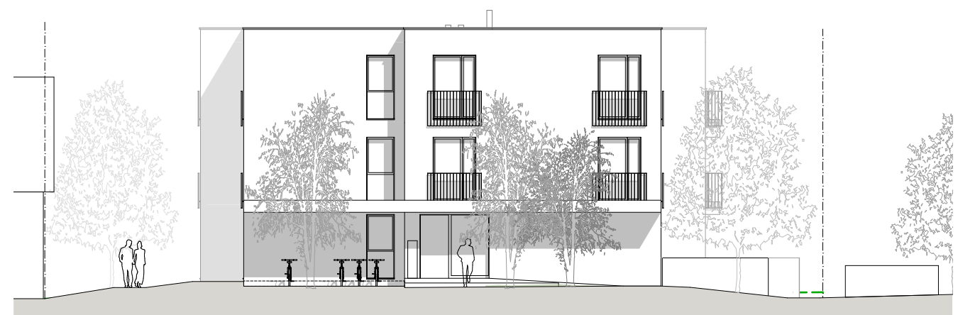
Ansicht Nord 1:200