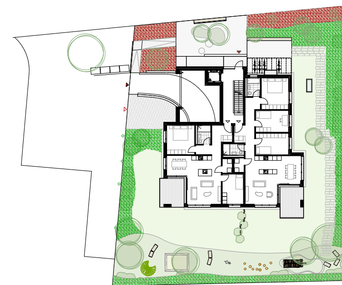
⌚ Erdgeschoss 1:500