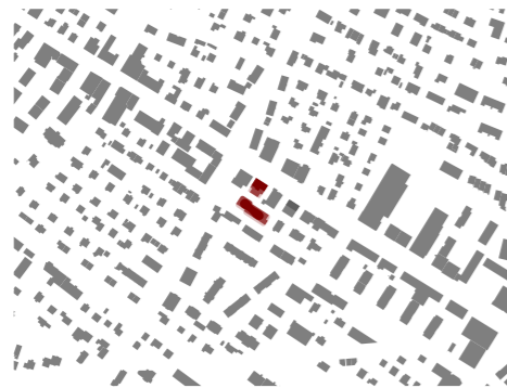
⌚ Schwarzplan 1:10000