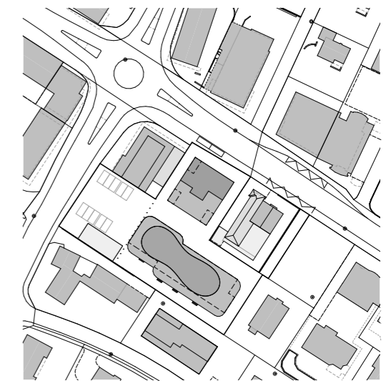
⌚ Situationsplan 1:2000