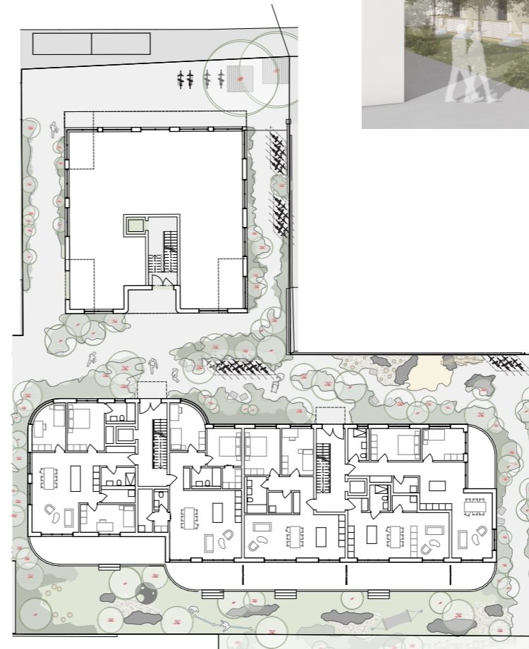
⌚ Umgebungsplan 1:500