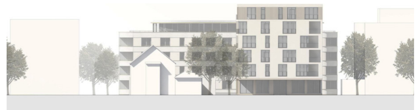
Ansicht Nord Landstrasse 1:500