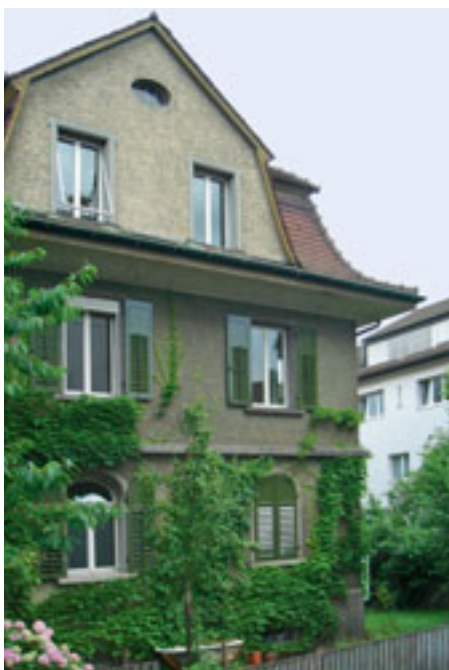
Die verträumte Liegenschaft stammt aus dem Jahr 1911.

Spezielle Bäder und Küchen für ein spezielles Haus: So lautete die Vorgabe der Bauherrin, die zudem einen fixen Kostenrahmen setzte. Also verwandelte der Architekt Kunstharz in Holz und tauchte die Bäder in Meerblau.