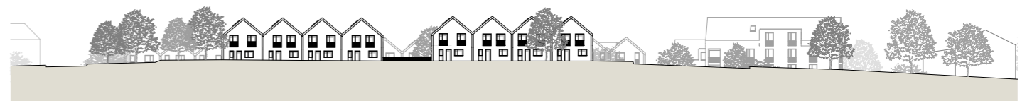
Ansicht Nordost 1:1000