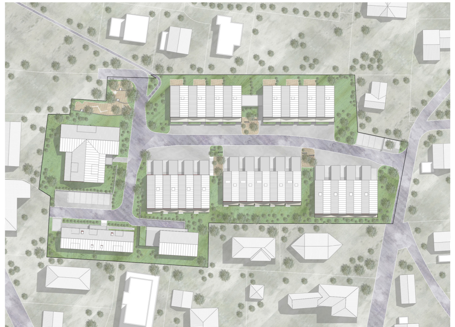
🕒 Situationsplan 1:1000