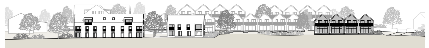
Ansicht Südwest 1:1000