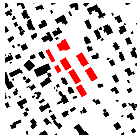
⌚ Schwarzplan 1:5'000

Auftraggeber Corpora Immobilien AG Aarau