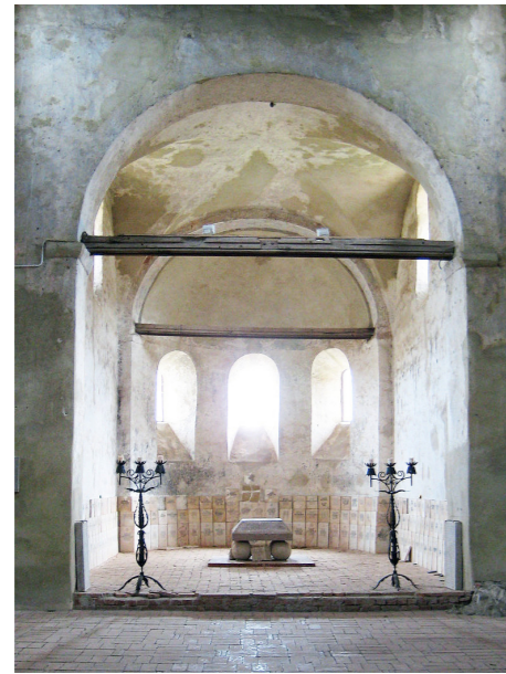
Referenz Chor der Kirche Michelsberg