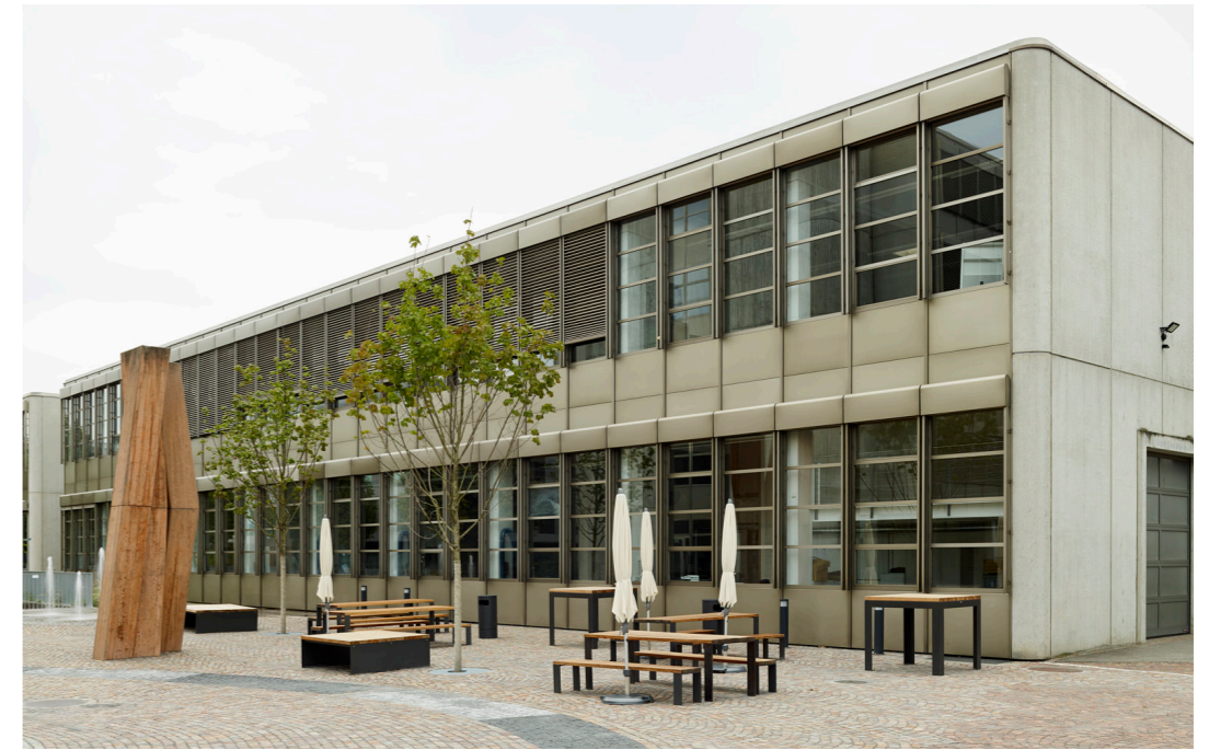
Fotografie: Goran Potkonjak