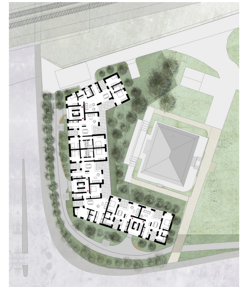
⌚ Umgebungsplan 1:500