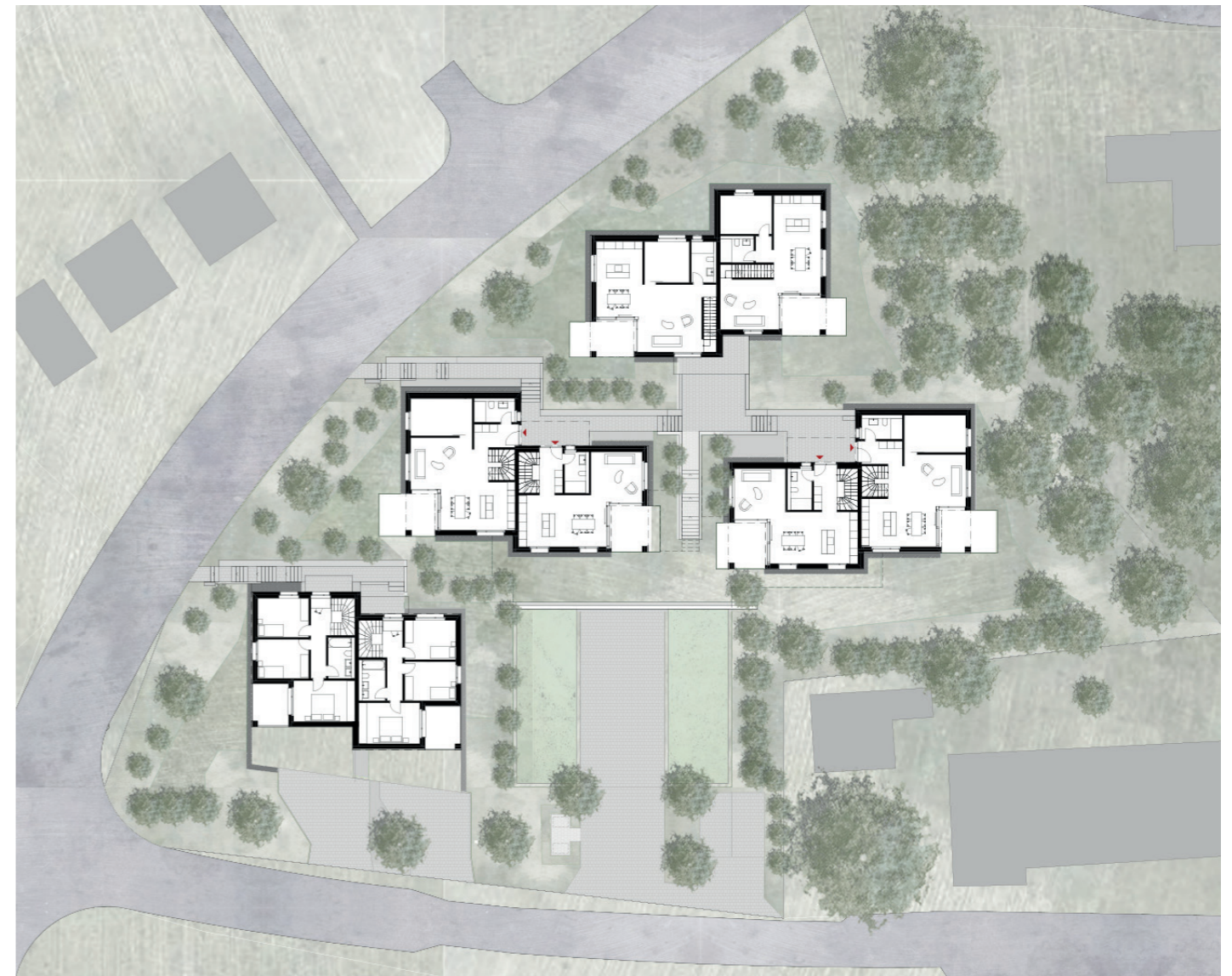
⌚ Situation, Grundriss Ebene 2 1:500