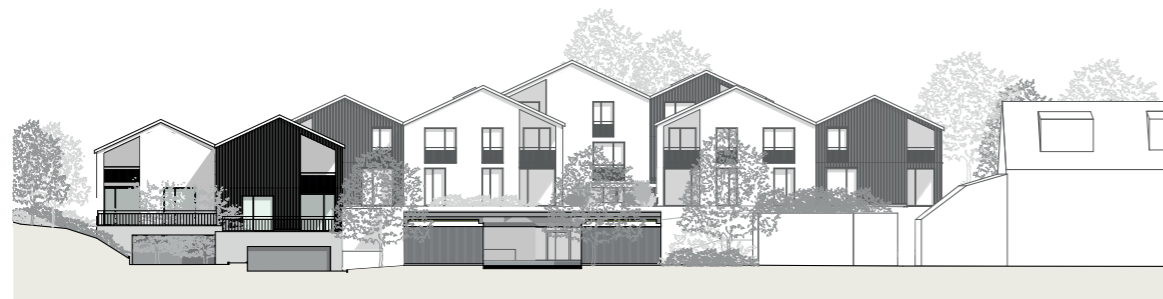
Süd Ansicht 1:500