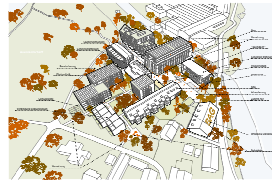
3D Model - Konklusion

Spezielle Eigenschaften Erneuern, Erweitern Ersetzen