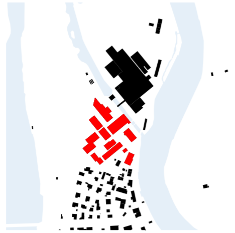
⌚ Schwarzplan 1:10'000