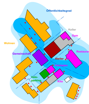
Schema - Öffentlichkeitsgrad & EG - Nutzung