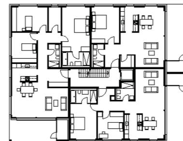
⌚ Grundriss OG Haus A 1:500