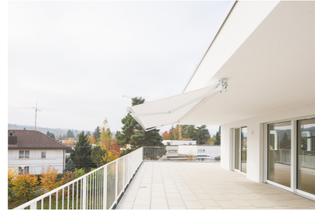
Fotografie von Radek Brunecky