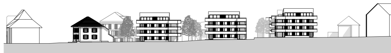
Ansicht Süd 1:1000