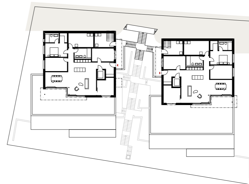
🕒 Ebene 3 1:500