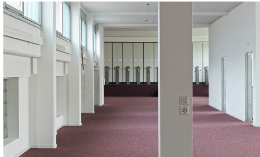
Im Hintergrund Archivanlage auf Bodenverstärkung