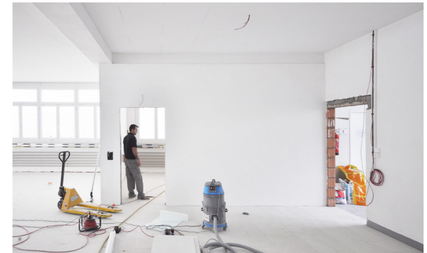
Einbau der beiden Einzelbüros