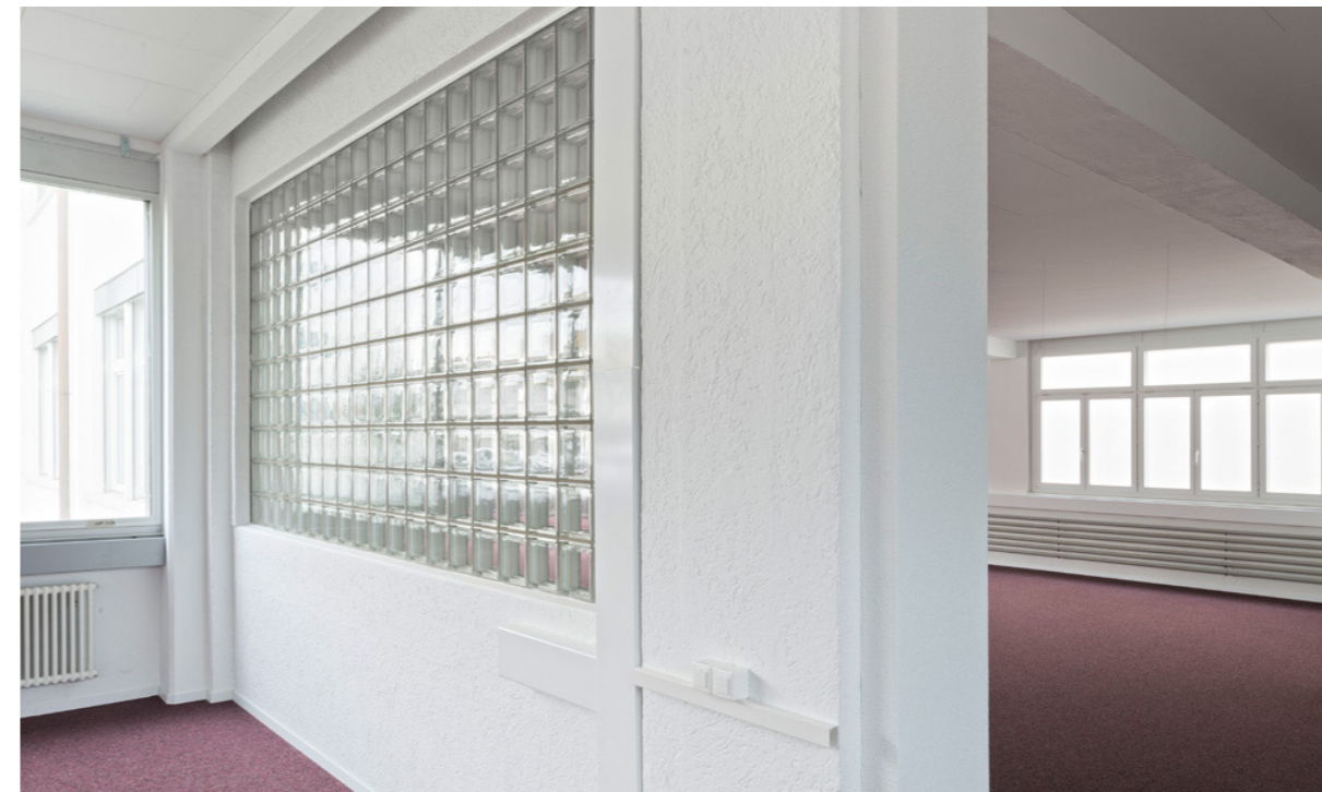
Mieterausbau erhält die Tektonik und Geschichte der Gewerbehalle